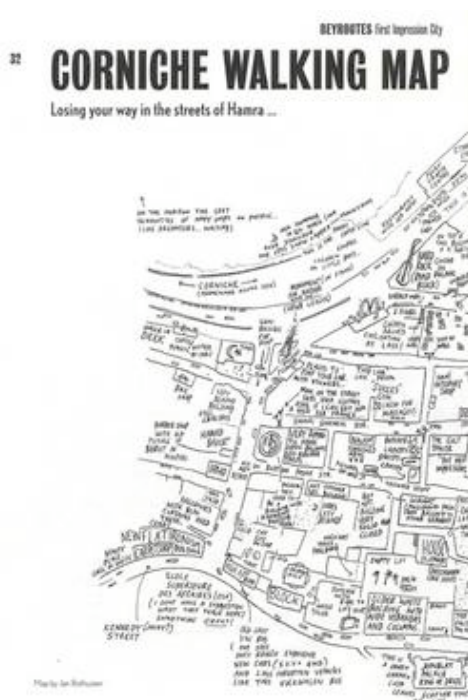
pagina's uit Beyroutes

Beyroutes. A guide to Beirut is het resultaat van een aantal workshops en bijeenkomsten in de Libanese hoofdstad. Hoewel geen standaard reisgids, de publicatie neemt de sociale infrastructuur als uitgangspunt, kan de gids een nuttig instrument zijn voor stedenbouwkundigen die geïnteresseerd zijn in een bottom-up benadering, maar ook voor een breder publiek dat weinig van Beiroet weet.